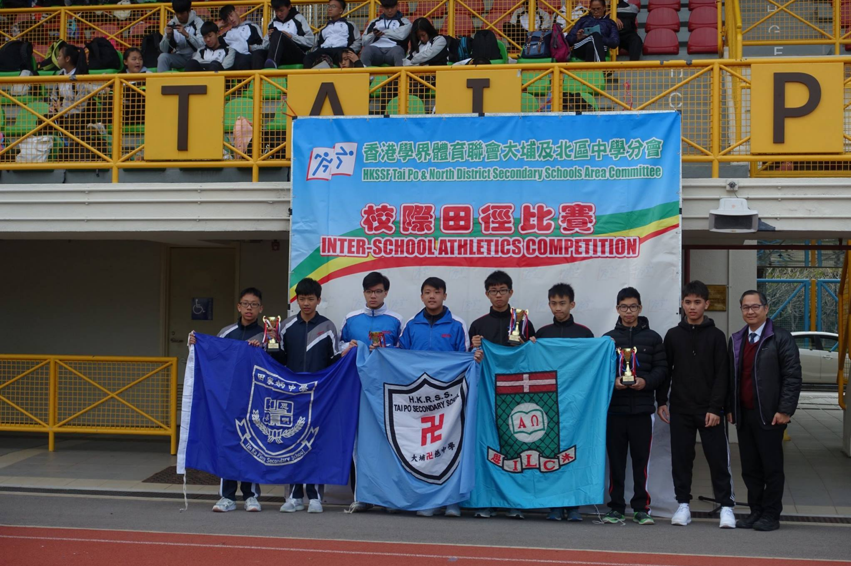
Boys C 男子丙組