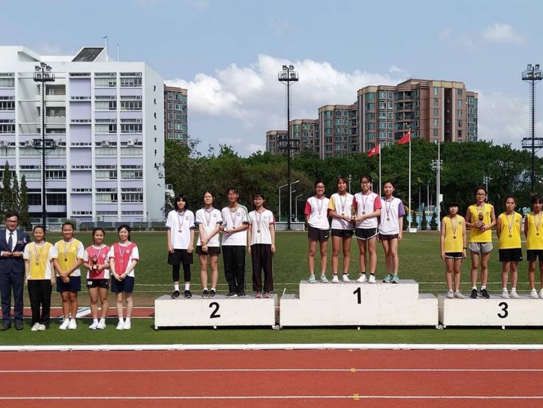
Girls 4x100M Invitation Relay 女子組 4x100米接力邀請賽 Champion 冠軍