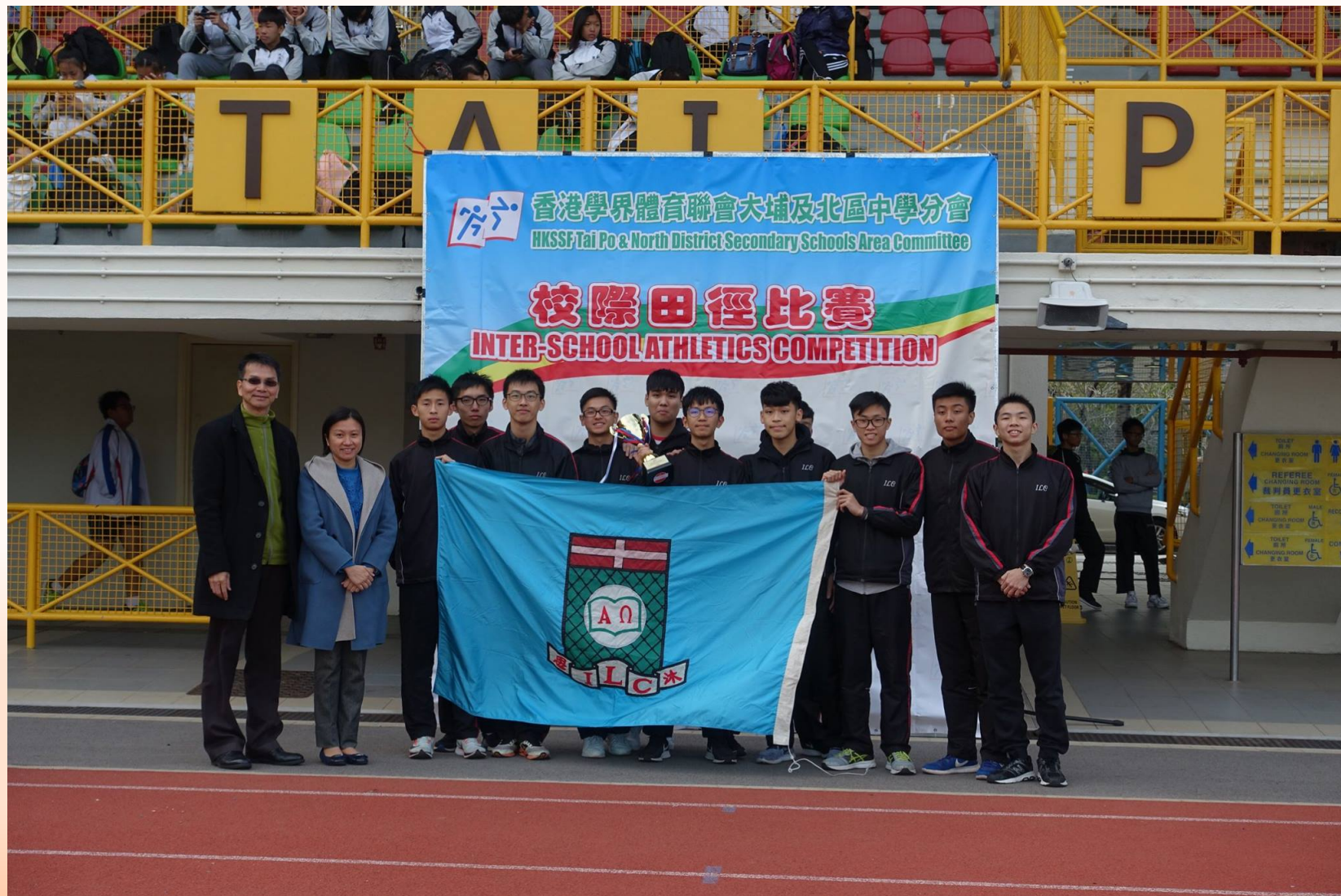
Boys A 男子甲組