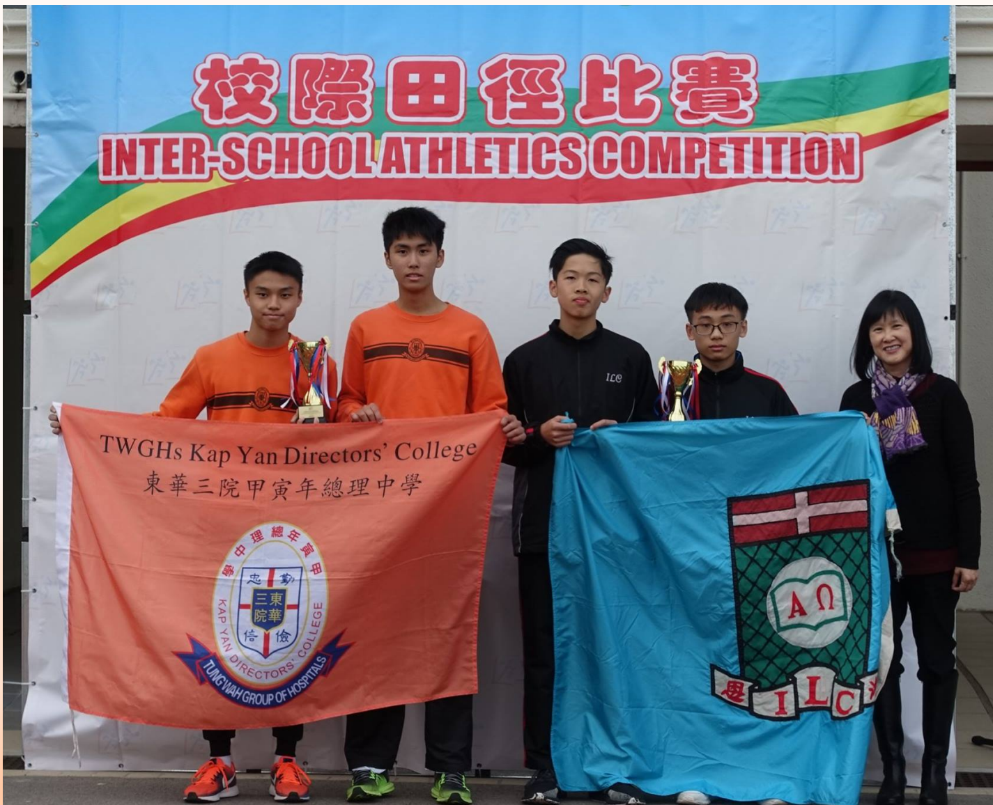
Boys B 男子乙組