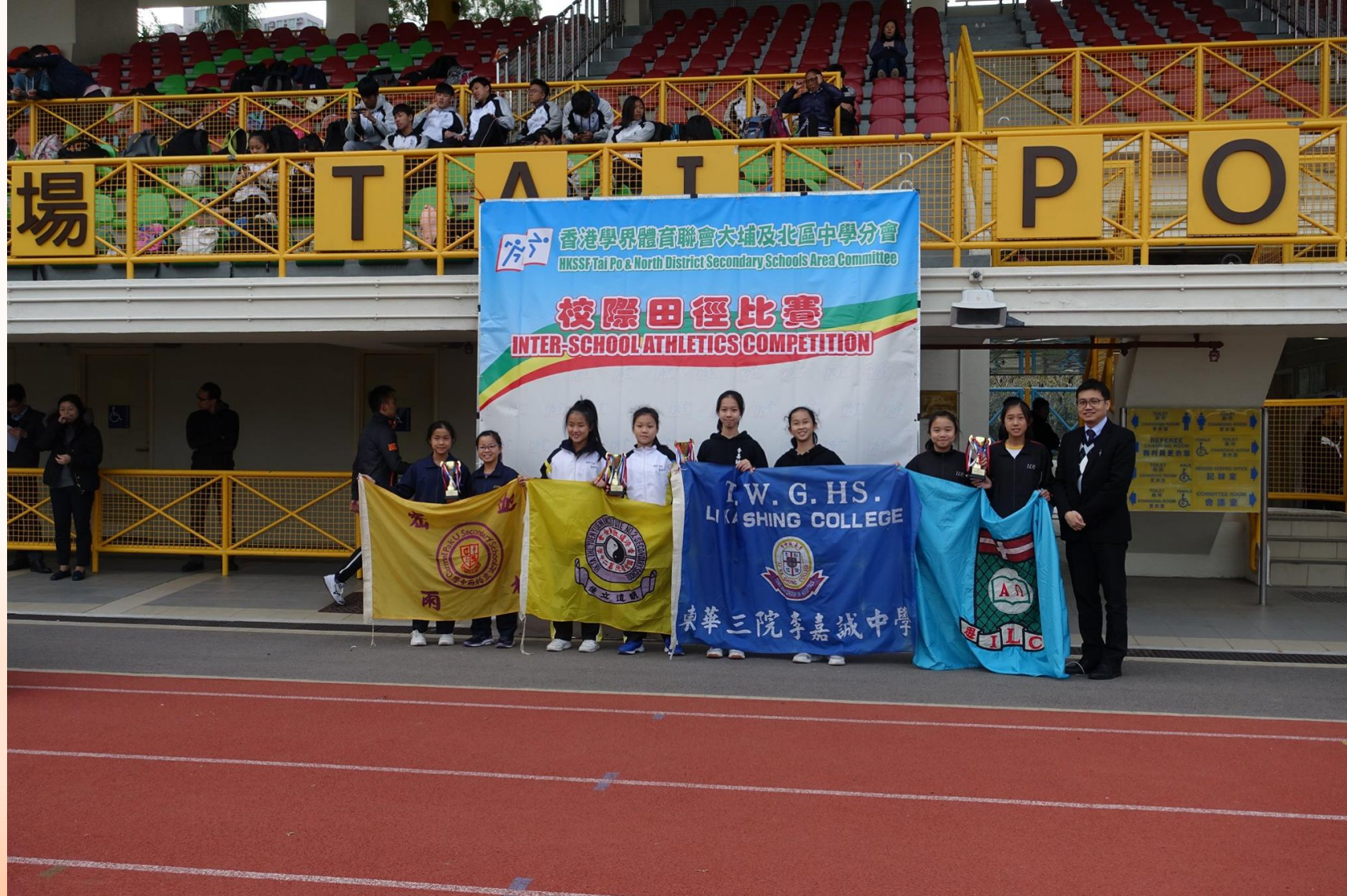
Girls C 女子丙組