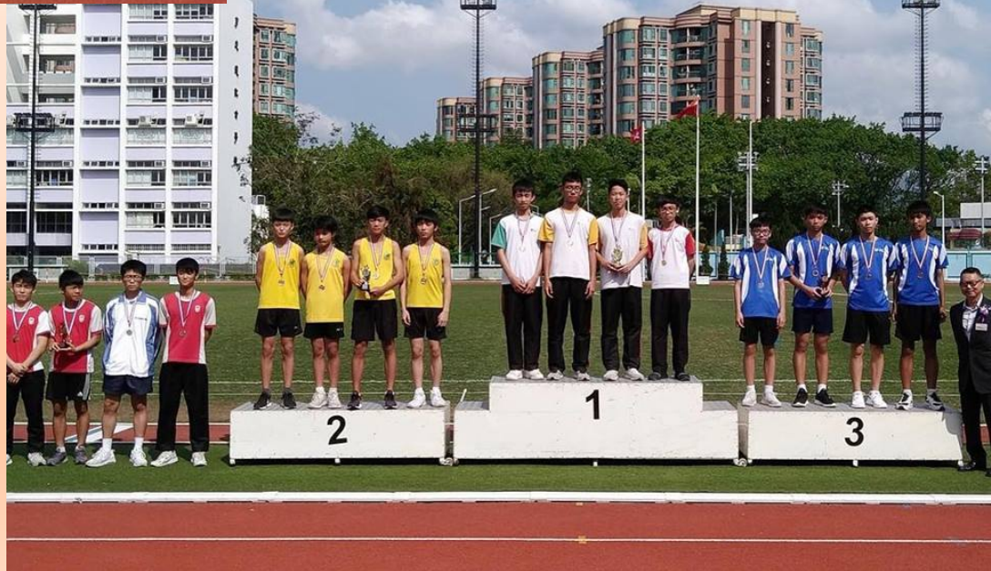
Boys 4x100M Invitation Relay 男子組 4x100米接力邀請賽 Champion 冠軍