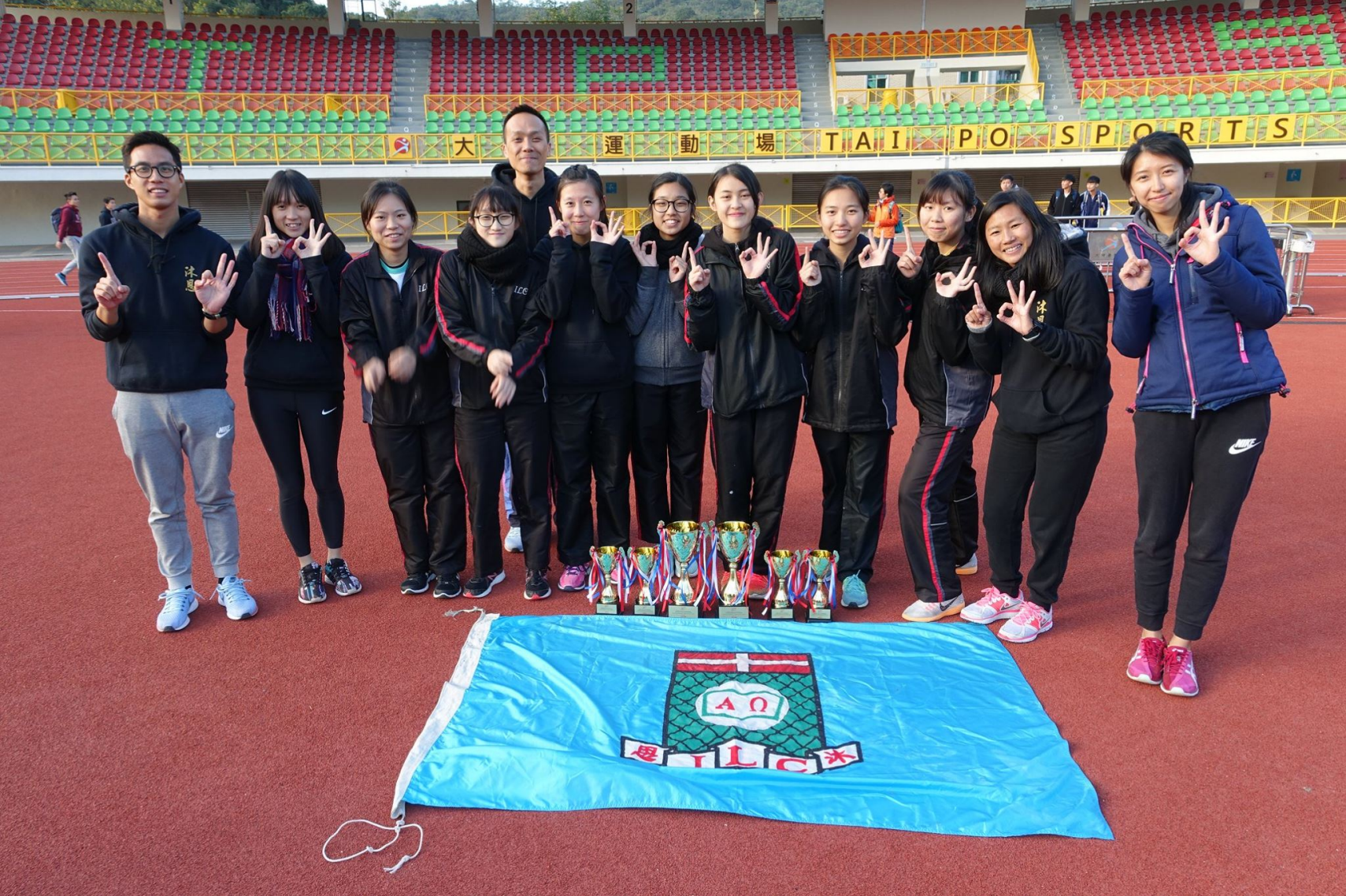
Girls A 女子甲組